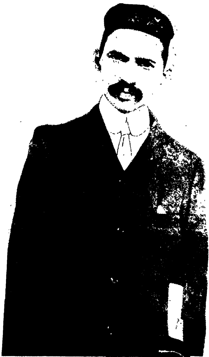
गांधीजी, १९०० — जोहानिसबर्गमें